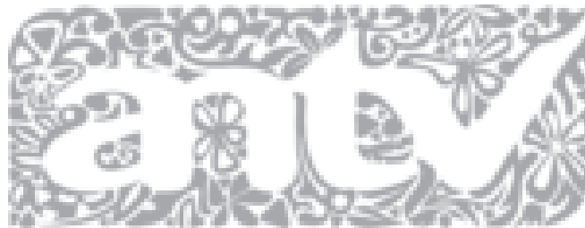
Gambar 2.7 Logo 2013

Logo ANTV dari 20 September 2009 – 20 Juli 2012 (Logo perusahaan sampai 31 Desember 2016).