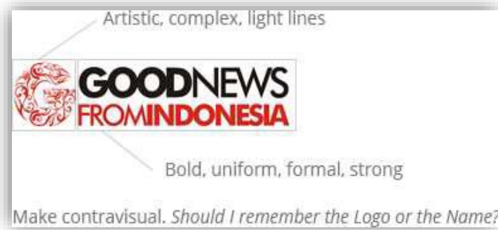
Gambar 2.1 Logo Pertama Good News From Indonesia .

Pada awalnya logo yang pertamakali dimiliki dan dipakai oleh Good News From Indonesia berbentuk seperti gambar di atas. Namun pada tahun 2013 Good News From Indonesia melakukan perubahan bentuk logo pada medianya. Logo tersebut kemudian dipakai oleh Good News From Indonesia hingga saat ini. Perubahan tersebut salah satunya terlihat lewat bentuk ornamen dan bentuk tulisan yang dimiliki pada logo baru.