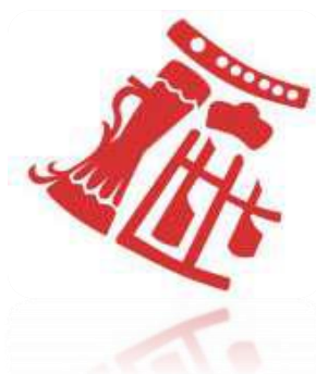
Gambar 2.4 Motif alat musik

Gambar di atas mencoba menjelaskan keberagaman kebiasaan, perkembangan dan kekhasan nusantara yang simbolisasinya dilakukan dengan kombinasi sehelai kain dengan motif batik yang diwakili oleh batik parang dari daerah Jawa dan pulau-pulau lain.