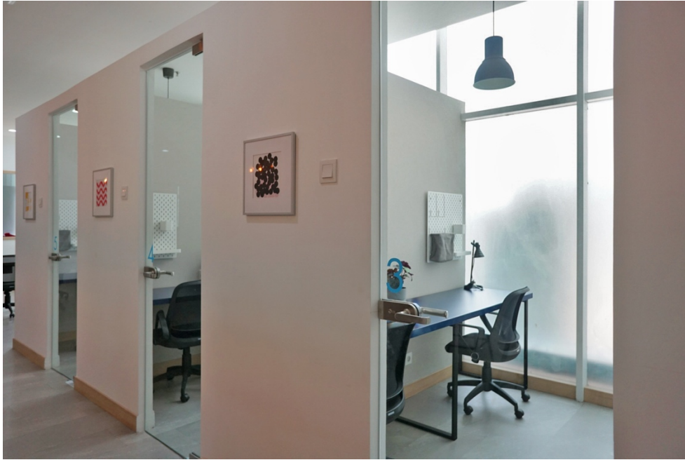
Gambar 2.4 Private Office

Private Office atau kantor pribadi dengan desain kantor yang modern terjaga privasinya, dan dapat lebih fokus dalam pekerjaan yang bisa diisi dengan sendiri atau dua orang. Dengan di berikan furnitur yang membuat terasa seperti ruangan kantor sendiri dan bisa meletakkan barang sendiri saat sudah selesai bekerja karna dapat di kunci dan kunci di simpan pengguna Private Office , dan tidak perlu khawatir untuk kehilangan barang yang disimpan dan dapat menyesuaikan kebutuhannya.