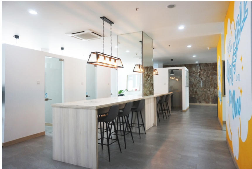
Gambar 2.2 Flexible Desk

Flexible desk adalah tempat untuk bekerja yang berada di ruangan terbuka, sehingga dapat bertemu dengan orang dari perusahaan yang berbeda. Flexible desk dapat diisi sampai 12 orang, dengan kursi yang tinggi dan nyaman di gunakan dengan meja yang menyambung panjang dilengkapi portal untuk charge laptop atau handphone pengguna, juga dapat di gunakan untuk berdiskusi juga karna dengan tempat yang berkapasitas banyak. Dengan susasana arsitektur yang modern dengan di berikannya lampu yang berwarna orange untuk memberikan kesan berenergi atau agar pengguna merasa fresh , dan bagian tembok dengan adanya mural yang memberikan motivasi agar terus bersemangat.