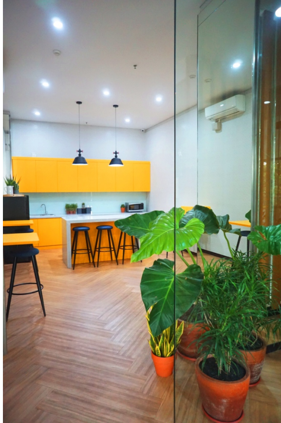
Gambar 2.7 Pantry

Tempat untuk beristirahat untuk makan atau minum, dan di sediakannya minuman gratis bagi yang menggunakan co working space ini, yang berupa kopi, teh dan air mineral.