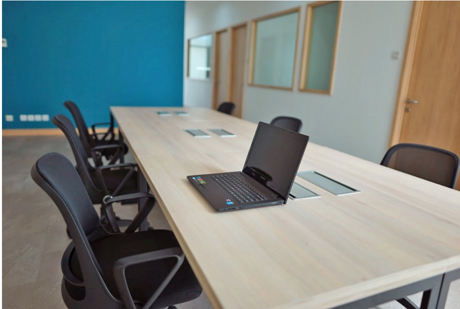
Gambar 2.3 Dedicated Desk

Dedicated desk berada di ruang terbuka juga agar tetap bisa berinteraksi dan bertukar pikiran dengan yang lain, namun yang membedakan adalah kursi beroda yang nyaman dan enak di gunakan untuk bersandar dan dapat digerakan sambil duduk, desk tersebut dapat diisi sampai 6 orang yang juga dilengkapi portal untuk mencharge laptop ataupun handphone , meja yang panjang dan lebar agar dapat memberikan jarak antar kursi agar pengguna dedicated desk dapat menyesuaikan kenyamanannya.