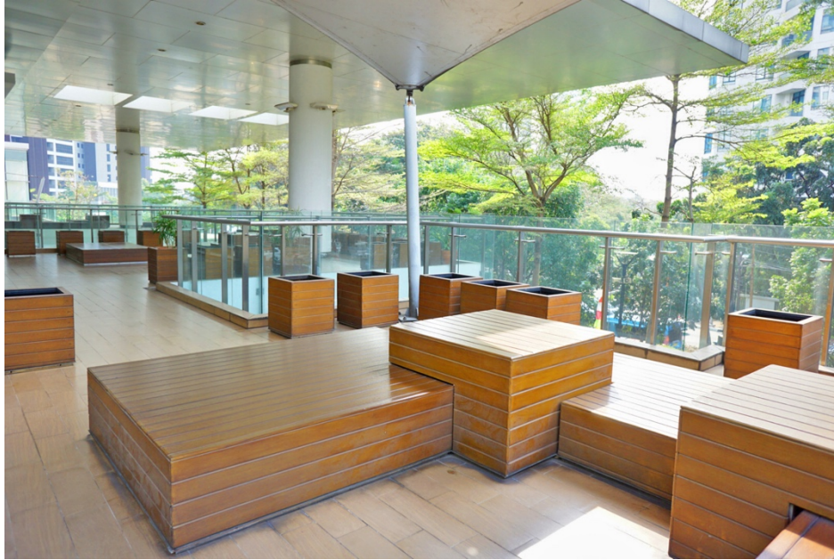
Gambar 2.6 Outdoor Terace

Salah satu tempat untuk refreshing juga, tempat untuk bagi yang merokok, dan juga bisa di jadikan tempat untuk bekerja jika di butuhkan nya suasana kerja baru dengan mendapatkan sinar matahari bisa terisi lebih dari 10 orang biasa di gunakan untuk beristirahat juga untuk menghilangkan penat dan biasa di gunakan jika suatu perusahaan mengadakan acara seperti hari nasional 17 Agustus dengan bermacam-macam lomba, karna dapat terisi orang banyak sekali. Dan tertutup di bagian atas agar tidak kehujanan ataupun juga kepanasan.