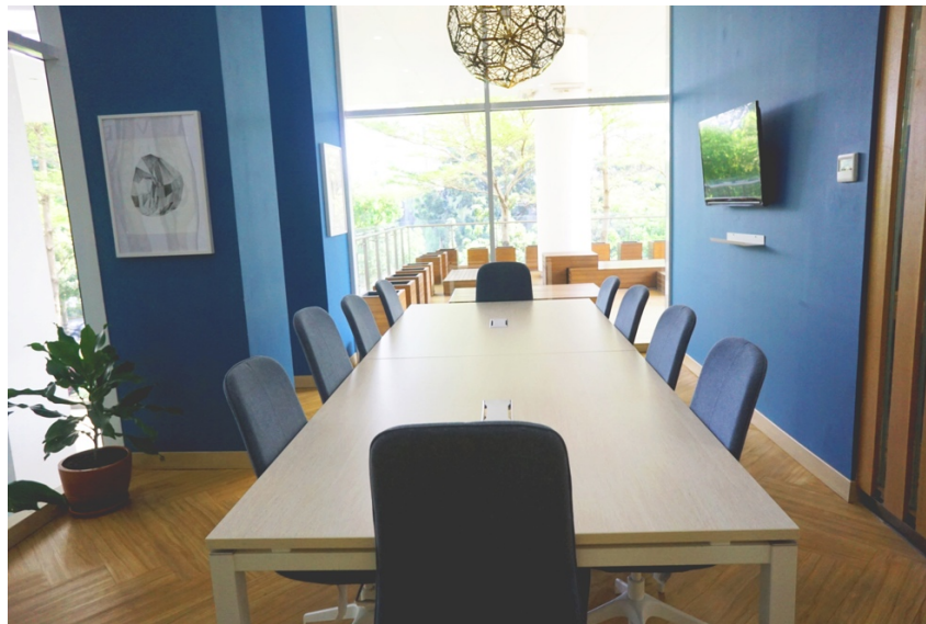
Gambar 2.1 Meeting Room

Setiap perusahaan sering melakukan rapat baik rapat tim atau rapat dengan klien, untuk itu disediakan ruang rapat dengan kapasitas sampai 10 orang, dilengkapi proyektor untuk presentasi. Menggunakan kursi yang nyaman dan empuk, dengan design ruangan yang