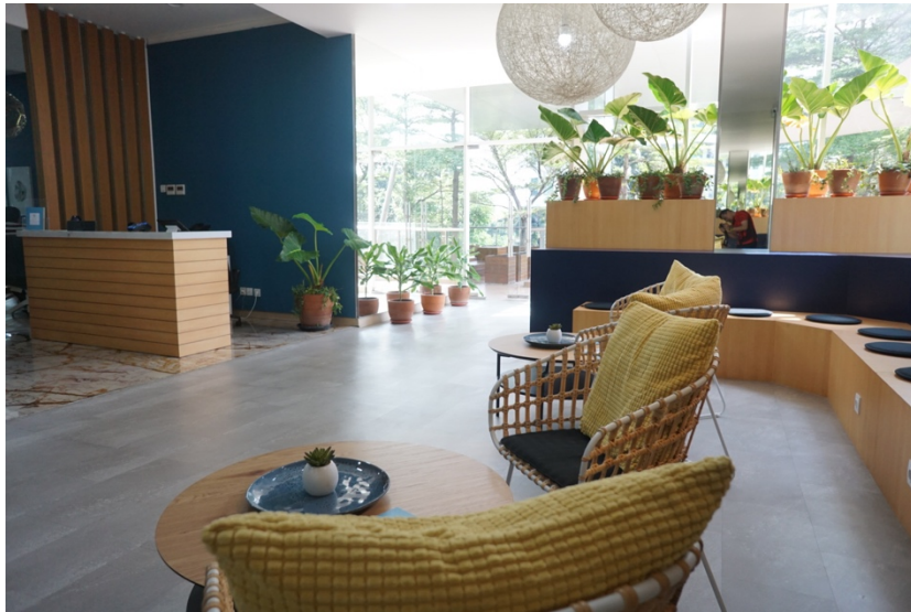
Gambar 2.5 Lounge

Lounge ini adalah ruang bersama, di sela aktivitas yang padat di perlukan refreshing. Fasilitas lounge tempat dimana bisa bersantai sejenak dengan adanya bantal yang empuk yang nyaman, mengobrol dengan orang lain, atau sekedar duduk-duduk saja untuk mencari inspirasi dan memberikan kesan yang fresh karena adanya tanaman di sekeliling lounge , dinding yang ada tanaman yang dirancang oleh Larch Studio, dengan desain modern untuk menciptakan ketenangan. Bisa juga di gunakan tempat untuk ngopi santai atau makan saat jam istirahat atau biasa di gunakan jika suatu perusahaan kedatangan klien, dan menjadi tempat menunggu klien.