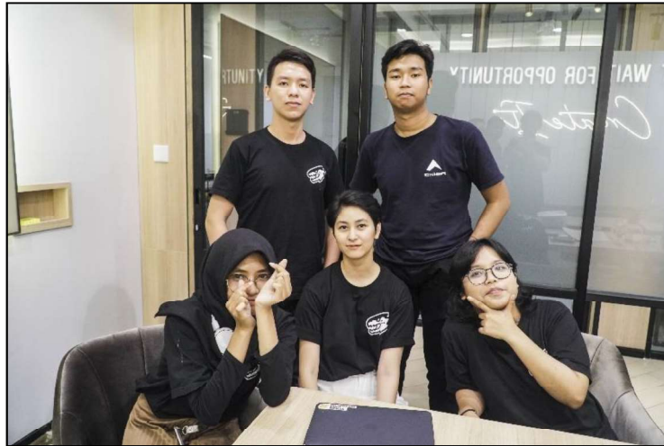
Gambar 2.2. Penulis bersama tim digital marketing