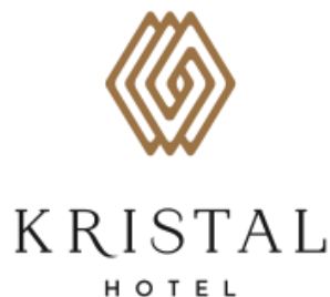
Gambar 2.1 Logo Kristal Hotel