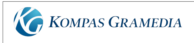
Gambar 2.1 Logo Kompas Gramedia

produk dan jasa dari Kompas Gramedia. Bersama seluruh komponen bangsa, Kompas Gramedia masih terus menjunjung visi misi mereka dengan terus maju, bergerak dinamis serta mencerahkan manusia (Kompas Gramedia, 2019).