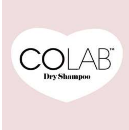
Gambar 2.3 Logo COLAB Dry Shampoo