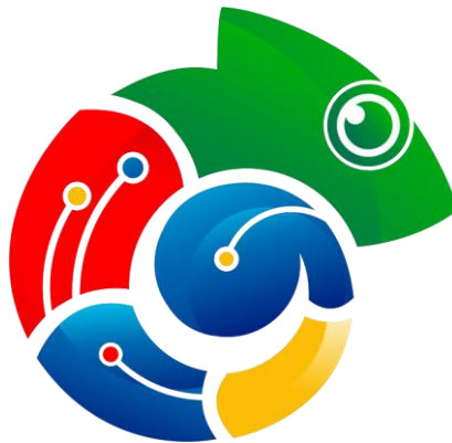
Gambar 2.1 Logo Blinkgoo

PT. Mediatama Teknologi Indonesia didirikan pada pertengahan tahun 2019 dan merupakan perusahaan yang bergerak di bidang pengembangan situs web yang menyediakan banyak marketplace dalam satu situs yang bertujuan untuk memudahkan pengguna. Situs web yang dimaksud bernama Blinkgoo yang merupakan produk utama dari PT. Mediatama Teknologi Indonesia.