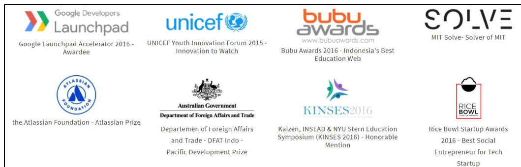
Gambar 2. 1. Penghargaan yang telah diraih Ruangguru

Ruangguru saat ini memiliki gedung di Jakarta dan Bandung Ruangguru adalah perusahaan yang bergerak pada bidang pendidikan dan sudah banyak penghargaan yang diraih oleh Ruangguru meskipun baru berdiri pada tahun 2014 dan menurut website resmi Ruangguru, ruangguru mendapat penghargaan sebagai berikut.