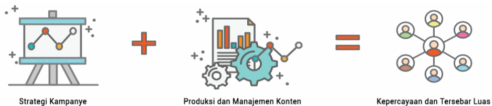
Gambar 2. 11 Alur Kerja GRID Voice.

GRID Voice memberikan layanan berupa content management yang dapat membuat bisnis anda mencapai target audiensi yang tepat, proses tersebut dimulai dengan merencanakan konsep kampanye, produksi konten, hingga kepada memantau hasil yang telah dikerjakan