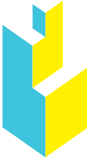
Gambar 2.6 Logo Nilai Competent Dalam 5C Kompas Gramedia.

Mengusung logo layaknya gedung pencakar langit yang bermakna tumbuh tinggi dibandingkan gedung-gedung lainnya, Kompas Gramedia berdiri kokoh menjadi panutan dan mengapresiasi berbagai prestasi yang telah ditorehkan oleh Kompas Gramedia.