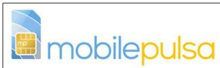
Gambar 2.1 Logo Mobilepulsa

Setelah berjalan selama satu tahun, Indobestdeal ditutup karena dianggap kurang sukses. Setelah Indobestdeal ditutup, perusahaan ini memulai produk baru dengan nama Mobilepulsa . Mobilepulsa dikembangkan oleh PT Indobest Artha Kreasi dengan tujuan untuk menjadikan Mobilepulsa sebagai platform pembayaran yang mudah bagi masyarakat. Berdasarkan dengan tujuan tersebut, Mobilepulsa menyediakan layanan pembayaran berupa pembayaran pulsa, baik pulsa Prabayar maupun Pascabayar, pembayaran tagihan, seperti tagihan listrik, tagihan asuransi BPJS Kesehatan, tagihan air, dan lain-lain, serta pembayaran lainnya. Gambar 2.1 merupakan logo dari Mobilepulsa .