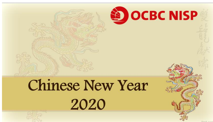
Gambar 2.5 OCBC NISP Konsep Chinese New Year 2020

Posisi penulis selama berada di BDI adalah berada hampir di seluruh posisi, kecuali pemimpin tim dan multimedia. Penulis pernah diberikan tugas menjadi asisten Project Manager yang mana penulis berperan sebagai pembuat materi yang akan di presentasikan di hadapan klien.