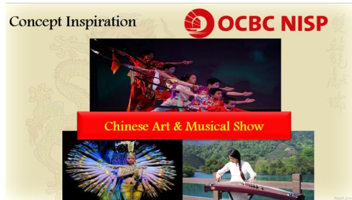
Gambar 2.6 OCBC NISP Chinese New Year 2020