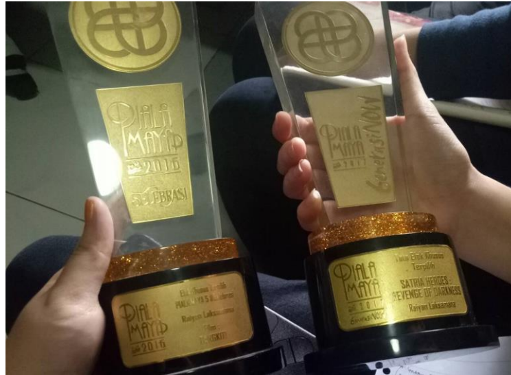
Gambar 2. 3 Penghargaan Studio Imagia

Dari proyek tersebut, Studio Imagia menerima beberapa penghargaan dari Piala Maya sebagai Tata Efek Khusus Terbaik pada film Bangkit (2016) dan Satria Heroes-Revenge of Darkness (2017).