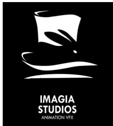
Gambar 2. 1 Logo Studio Imagia