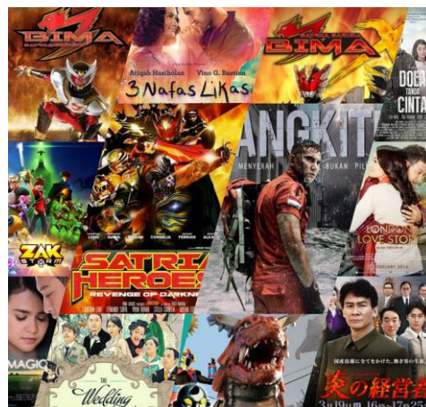
Gambar 2.2 Proyek Studio Imagia

( https://www.facebook.com/877465905721097/photos/pb.877465905721097.-2207520000../1303698659764484/?type=3&theater , 2020)