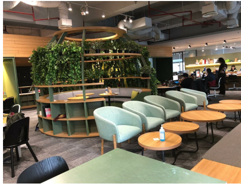
Gambar 2.3. Kantor Flock Creative Network 2

Dilansir dari situs resmi Flock Creative Network https://flock.company/about/ mengatakan bahwa Flock Creative Network merupakan pusat kolaborasi yang berfokus pada semangat komunal dalam memberikan ide serta solusi kreatif dan inovatif untuk meningkatkan merek sampai mencapai ketinggian tiga pilar inti yaitu :