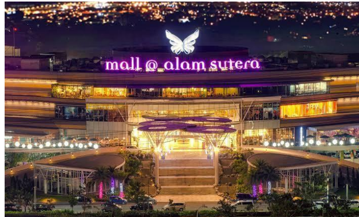
Gambar 2.1 Mall @ Alam Sutera