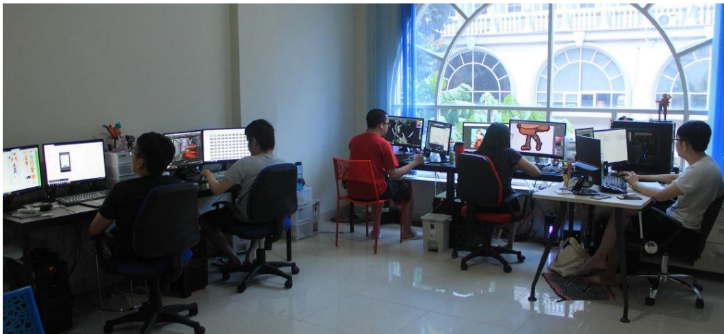
Gambar 2.1. Suasana Tempat Kerja RedRain Studio

RedRain Studio adalah sebuah perusahaan yang berkembang dalam bidang industri kreatif yang berlokasi di Sedayu Square, Jalan Outer Ring Road, RT.6/RW.12, Cengkareng. RedRain Studio berdiri pada tahun 2016 sebagai sebuah perusahaan yang berfokus pada pengembangan game dan pembuatan aset game . RedRain Studio menyediakan jasa dalam pembuatan game mulai dari programming , pembuatan aset dua dimensi dan tiga dimensi, ilustrasi, animasi pendek, AR dan juga VR.