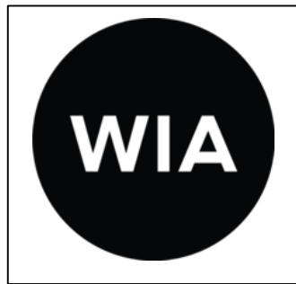
Gambar 2.1 Logo Perusahaan Wearinasia