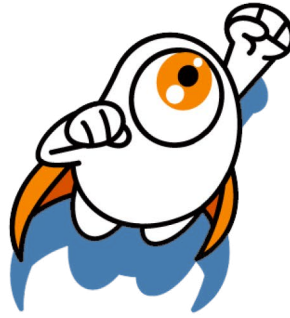
Gambar 2.1 Logo Kumata (Dokumentasi perusahaan)

Kumata memiliki logo berupa sesosok monster bermata satu. Secara visual, logo tersebut menggambarkan semangat Kumata untuk mencapai keinginan setinggi-tingginya dalam industri kreatif.