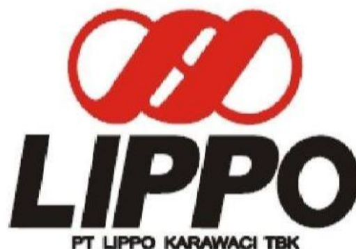
Gambar 2.1. Logo PT. Lippo Karawaci TBK

PT. Lippo Karawaci TBK memiliki visi yang bertujuan untuk menjadi perusahaan properti terkemuka dengan komitmen yang kuat untuk memberikan pengaruh positif pada kehidupan masyarakat juga meningkatkan nilai saham untuk para investor. Sementara itu, misi PT. Lippo Karawaci TBK adalah untuk memenuhi kebutuhan masyarakat Indonesia kelas menengah dan kelas atas untuk perumahan, apartment, pusat perbelanjaan, pengembangan komersial, pelayanan Kesehatan, hiburan dan infrastruktur, selain itu, ada juga misi lain dari PT. Lippo Karawaci TBK yaitu untuk menyediakan lingkungan hidup yang mengutamakan peningkatan fisik, sosial dan spiritual untuk masyarakatnya dan juga lingkungan hijau yang terbaik untuk setiap proyeknya.