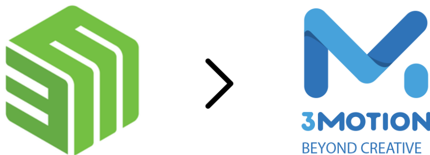
Gambar 2.2 Logo 3Motion

Production untuk mendetilkkan visual sebelum eksekusi. Production Menghasilkan konten visual dan menyampaikan pesan yang bermakna dengan cara yang benar. Post production Menyelesaikan dan menyempurnakan konten visual ke dalam karya terakhir, siap untuk melibatkan dan menginspirasi penonton. 3Motion dan Happening Films aktif di social media terutama Instagram , mengupdate seputar hal – hal menarik dan terkini.