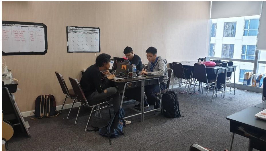
Gambar 2.1 Ruang Kantor