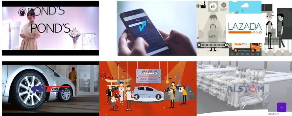
Gambar 2.5 Porfolio Happening Films

Happening Films Portofolio dapat dilihat pada website www.hpngfilms.id . Happening Films telah mengerjakan 38 Project dari tahun 2018.