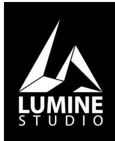
Gambar 2.2. Logo Lumine Studio ( www.luminestudio.com )

Logo Lumine Studio divisualisasikan dengan bentuk huruf L dan huruf S sebagai inisial nama studio. Inisial tersebut disusun sedemikian rupa dengan menggunakan bentuk – bentuk sehingga terlihat seperti objek 3D yang melambangkan perjuangan Lumine Studio di industri animasi 3D. Bentuk – bentuk yang terputus dan beragam menyusun logo Lumine Studio juga melambangkan keberagaman yang terdapat di Lumine studio