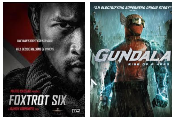
Gambar 2.1. Poster Foxtrot Six dan Gundala

Lumine Studio merupakan studio animasi berbasis di Kota Jakarta yang didirikan pada tahun 2006. Studio ini dibangun oleh talenta – talenta kreatif yang penuh semangat dengan pengetahuan di industri film dan animasi yang terus-menerus berkembang dalam memproduksi konten dengan standar yang tinggi. Studio ini bergerak fokus pada area animasi 3 dimensi di semua platform digital, hal ini termasuk kampanye digital, game, Serial animasi, dan visual effects untuk film panjang dengan satu dekade lebih pengalaman di industri animasi. Studio ini juga memiliki relasi bisnis yang sangat kuat dengan production house , produser, agensi iklan, game production , serta partner – partner lainnya yang tidak hanya dari dalam negeri namun juga luar negeri.