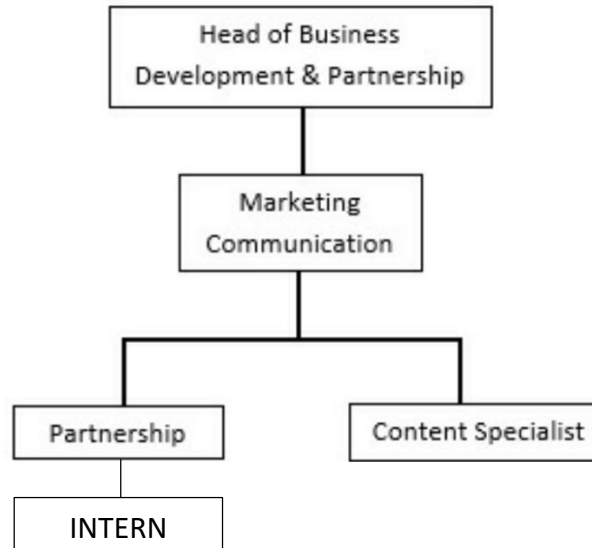
Gambar 2.3 Struktur Tim Marketing