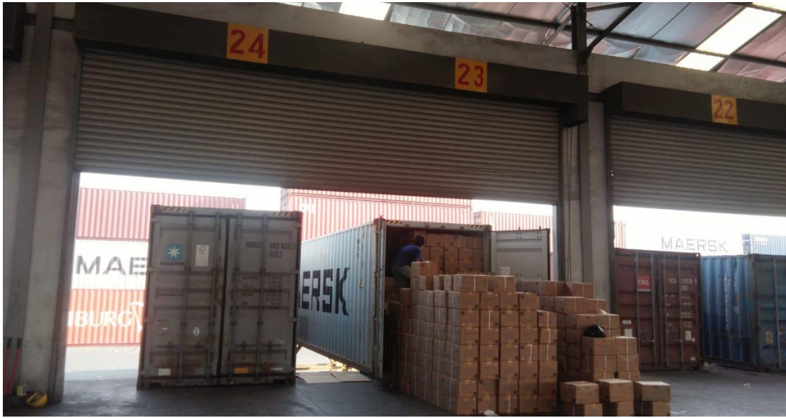
Gambar 10 Warehousing Tanjung Priok PT Inko Sukses Jaya