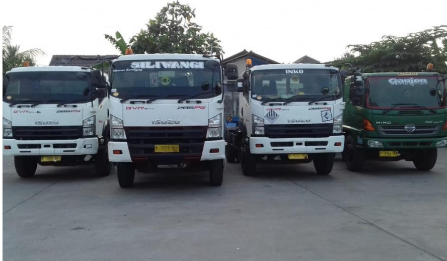
Gambar 12 Truckin PT Inko Sukses Mandiri

yang siap digunakan. 10 unit tersebut terdiri dari beberapa jenis truck mulai dari yang berukuran kecil(4x2) hingga Trailer 2 (4x2 dan 6x4).