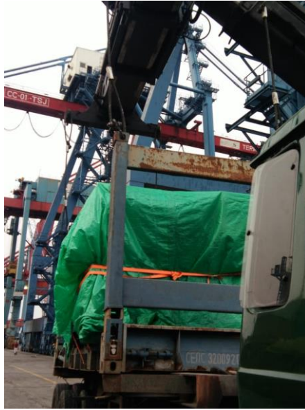
Gambar 11 Pengangkatan barang berat