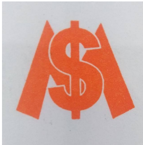
Gambar 13 Logo PT Inko Sukses Mandiri