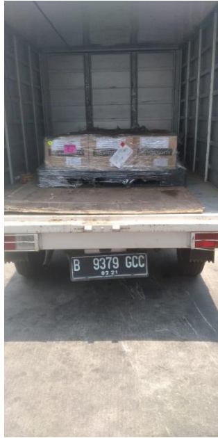
Gambar 14 Door to Door