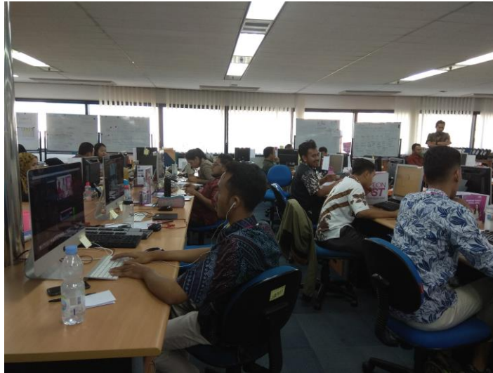
Gambar 2.2. Suasana Kantor

Kantor perusahaan ini terletak di Plaza Kuningan, Menara Selatan Lt. 3A, Jl. HR. Haruna Said, Kav. C11-14, Setiabudi, Jakarta Selatan 12490.