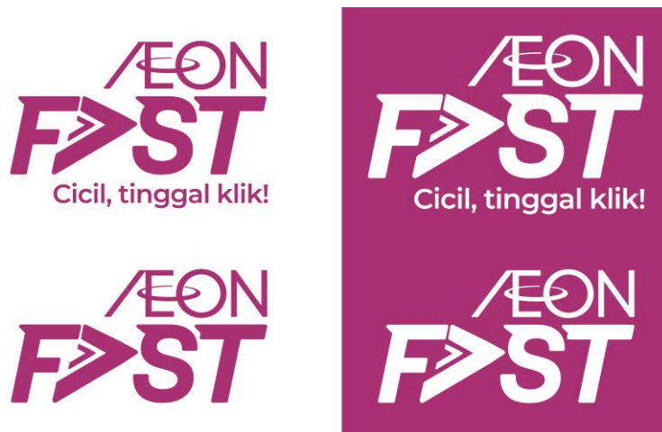
Gambar 2.8. Logo AEON Fast (Data Internal Perusahaan, 2019)

AEON Fast adalah fasilitas pembiayaan konsumen dalam bentuk aplikasi digital yang dikembangkan oleh perusahaan ini dan baru diluncurkan pada tahun 2019. Saat ini, aplikasi AEON Fast hanya dapat beroperasi di gadget Android. ( http://www.aeon.co.id/id/article/aeon/74/2/aeon-fast/0 , diakses 26 Agustus 2019)