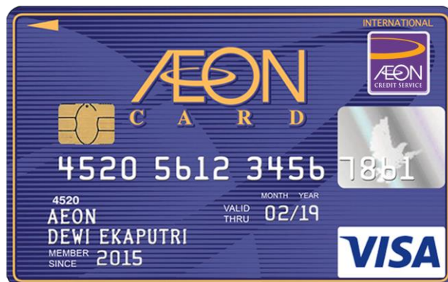
Gambar 2.6. Kartu Kredit AEON