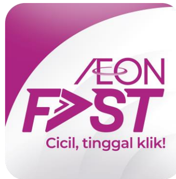
Gambar 2.7. Logo Aplikasi AEON Fast (Data Internal Perusahaan, 2019)