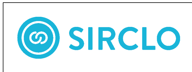
Gambar 2.1 Logo SIRCLO (SIRCLO, 2018)

Seiring waktu berjalan, perusahaan SIRCLO berkembang dan terlibat membantu perusahaan-perusahaan besar agar dapat menjual produknya di berbagai marketplace . Layanan kedua dinamakan SIRCLO Commerce, yang berupa end-to-end channel management solution agar perusahaan besar dapat masuk ke jalur distribusi online . Layanan tersebut membantu perusahaan-perusahaan besar melakukan sinkronisasi penjualan di berbagai marketplace .