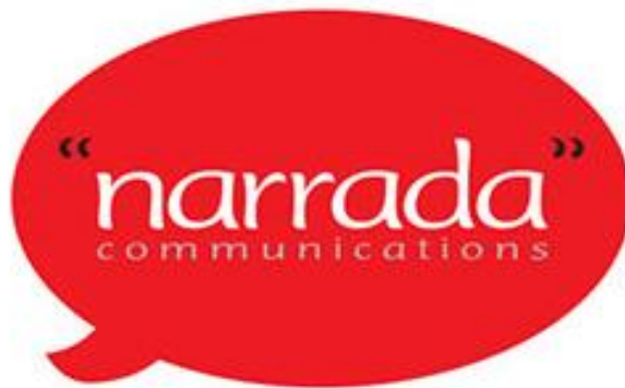
Gambar 2.1 Logo Narrada Communications

Narrada adalah digital advertising agency pertama yang ada di Indonesia. Narrada mulai berdiri dari tahun 1997 dengan nama PT. Artisi Paramitra Kencana. Awalnya Narrada merupakan agensi periklanan yang menjalankan layanan penuh dengan salah satu fokus pada bidang digital. Namun, memasuki tahun 2003, Narrada berganti nama perusahaan menjadi PT. Vidha Inti Prajapti dengan fokus utama di bidang digital. Mulai dari tahun 2009, Narrada khusus melayani di bidang periklanan digital saja. Seiring dengan bertambahnya klien yang dipegang oleh Narrada, PT. Vidha Inti Prajapti mulai membuka cabang dengan nama PT. Victory Investa Artha. Narrada pun dibagi menjadi dua bagian yaitu Narrada Communications dan Narrada ChannelO.