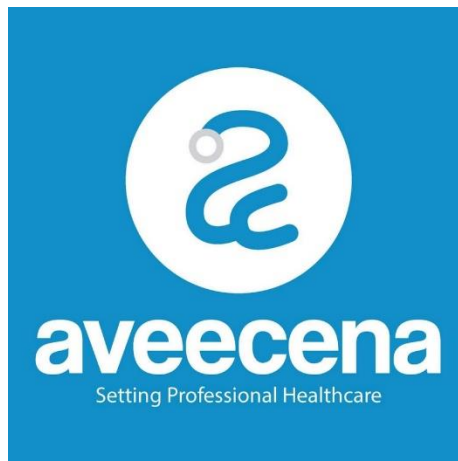
Gambar 2. 1 Logo Aveecena

PT Karya Husada Nusantara (Aveecena) merupakan sebuah perusahaan start-up . Aveecena fokus pada layanan atau platform pembelajaran online bagi praktisi-praktisi kesehatan. Aveecena juga tergabung sebagai anggota Asosiasi Telemedicine Indonesia (ATENSI) yang bekerjasama dengan Kementerian Kesehatan Republik Indonesia.