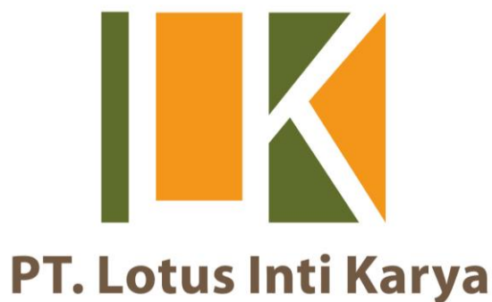
Gambar 2.6. Logo Lotus Logging

Pada tahun 2018, Lotus Group membuka bidang usaha yang berfokus kepada kebutuhan bidang outsourcing yang bernama Performa Staffing. Penyediaan jasa outsourcing yang disediakan oleh Performa Staffing berfokus kepada penyediaan Admin, Admin Akuntansi, Teknisi IT, dan Barista. Performa Staffing ingin sarana untuk dapat menyediakan solusi sumber daya manusia yang optimal dan maksimal.