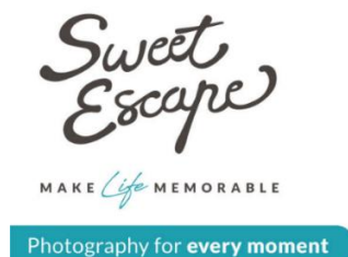
Gambar 2.1 Logo SweetEscape