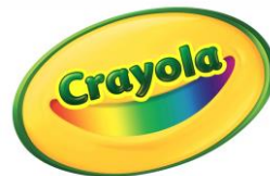
Gambar 2.4. Logo Crayola ( www.crayola.com , 2019)