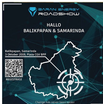
Gambar 3.3.2 Contoh desain pengumuman Event Launching Product kota Balikpapan

Dalam pelaksanaan program kerja magang semua tahapan perencanaan yang diungkapkan oleh Goldbatt terlaksanakan semua hanya saja beberapa definisi yang disebutkan dapat terjadi persis tetapi, dapat berkurang atau bertambah sesuai dengan kondisi yang terdapat di lapangan. Dalam semua tahapan event management di Baran Energy proses perencanaan yang paling sulit karena hampir setiap 2 minggu sekali event product launching dilaksanakan sehingga ketika masih melakukan perencanaan di event di 1 kota harus segera melakukan perencanaan di kota lain.