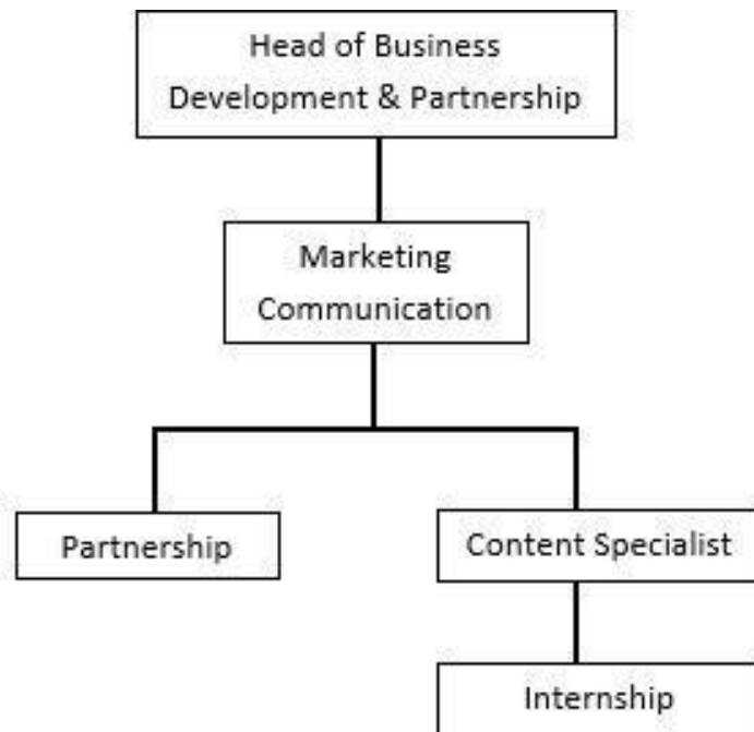
Gambar 2.4 Struktur Tim Marketing