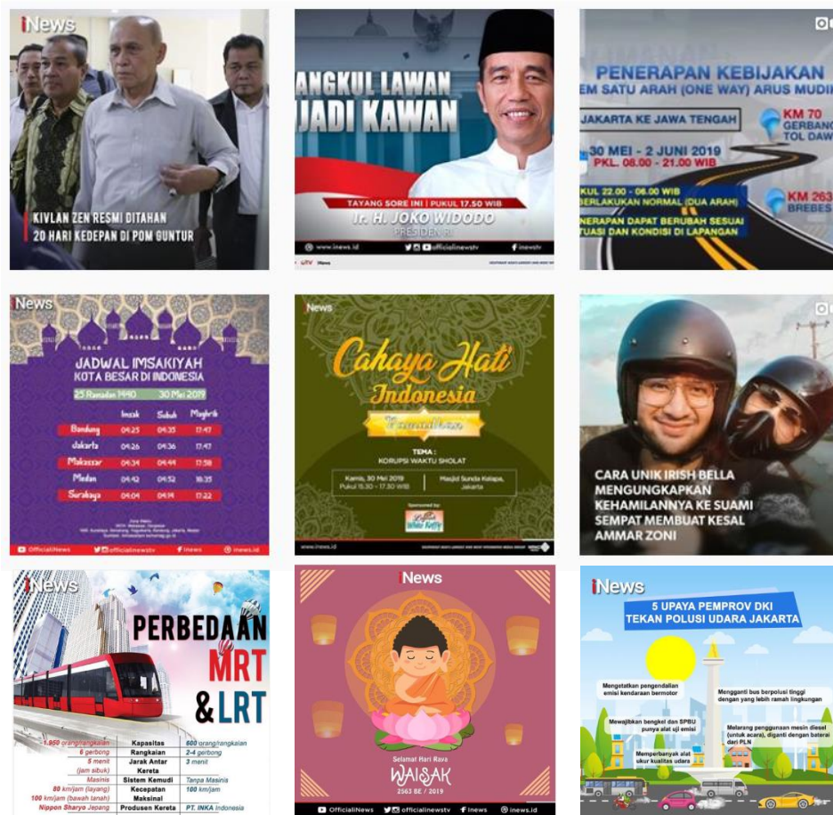
Gambar 2. 3 Kumpulan post akun Instagram iNews Mei-Juli 2019

Sebelum penulis melaksanakan magang di social media iNews MNC Media, akun social media MNC Media sendiri telah berjalan dengan baik. Namun berdasarkan hasil wawancara dengan Bapak Yu Pieter Yahya, penulis mengetahui bahwa dalam social media MNC Media memang belum terlalu aktif dalam pembuatan infografis. Sebelumnya akun social media MNC Media khususnya di Instagram lebih fokus dengan berita foto, berita video, dan promosi acara iNews TV. Berikut beberapa kumpulan post pada akun Instagram iNews sebelum penulis melakukan magang di iNews.