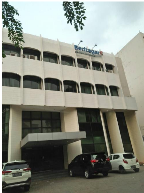
Gambar 2. 1. Gedung Perusahaan Beritagar.id

Beritagar.id merupakan perusahaan berbasis teknologi yang bergerak dalam bidang media daring (dalam jaringan). Beritagar.id berdiri pada tanggal 24 Agustus tahun 2015 dibawah naungan PT. Lintas Cipta Media (LCM) yang merupakan salah satu anak perusahaan Global Digital Prima (GDP) Venture. GDP Venture adalah perusahaan yang bergerak dalam bidang investasi bisnis konsumsi melalui internet dan aktif dalam berinvestasi di perusahaan rintisan Indonesia, seperti Kaskus yang merupakan “asuhan” GDP Venture. Diawali dari situs kurasi publik Lintas.me (2011) dan Beritagar.com (2012) dengan visi yang sama yaitu “Merawat Indonesia”, maka kedua situs ini sepakat untuk membangun media baru berbasis teknologi yang diberi nama Beritagar.id.