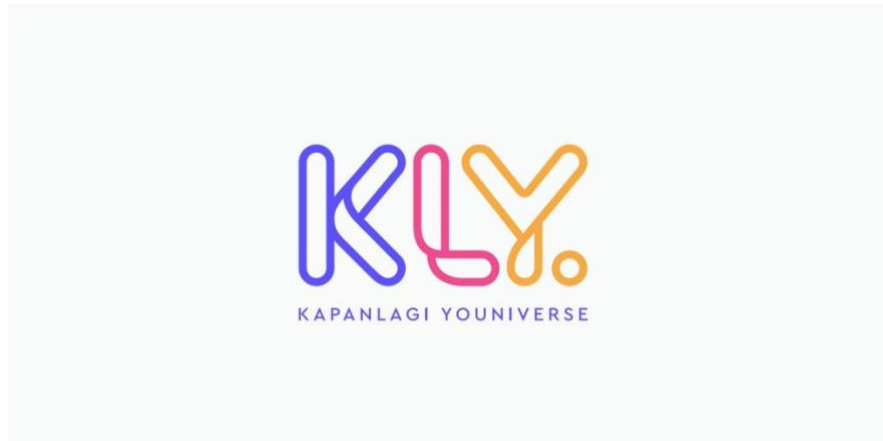
Gambar 2.1 Logo PT. KapanLagi Youniverse