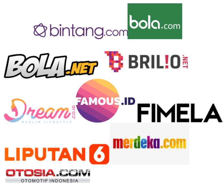
Gambar 2.2 Logo Brand media partner KLY