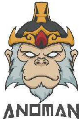
Gambar 2. 1 Logo Anoman Studio

Anoman Studio merupakan Indie Game Developer yang terbentuk dari tahun 2014 yang fokus kepada mobile dan desktop games. Anoman Studio sekarang bertempat di D'lofts Apartment - Komplek Sandang, Jalan Rawabelong E12 No. 8, Palmerah, RT.7/RW.10, Palmerah, Kec. Palmerah, Kota Jakarta Barat, Daerah Khusus Ibukota Jakarta 11480. Sejak tahun 2014, Anoman Studio telah meluncurkan berbagai macam HTML5, PC, dan mobile games . Game yang paling terkenal adalah Orbiz dan Mahabharat Warriors .