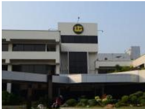
Gambar 2.1. Kantor United Tractors

Berdasarkan situs resmi perusahaan United Tractors (UT) yang penulis unggah, penulis mendapatkan informasi bahwa United Tractors merupakan perusahaan terbesar yang mendistribusikan peralatan berat di Indonesia, berlokasi di Jl. Raya Bekasi Km 22, Cakung, Jakarta Timur dan berdiri sejak tanggal 13 Oktober 1972. Pada 19 September 1989, dengan nama PT United Tractors Tbk (UNTR), UT melakukan penawaran saham atas PT Astra International Tbk sebagai pemegang saham inti. Penawaran saham ini membuat United Tractor menjadi perusahaan bersekala internasional dalam bidang alat berat, energi, dan pertambangan. Jaringan pendistribusian perusahaan berada di seluruh penjuru negeri, meliputi 19 kantor cabang, 22 kantor pendukung, dan 11 kantor perwakilan. United Tractor juga berperan dalam kontraktor pertambangan dan batu bara.