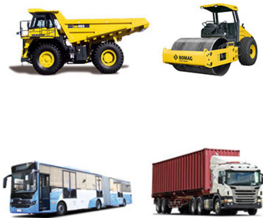
Gambar 2.5. Produk Alat Berat dan Transportasi United Tractors

United Tractor mengusung unit usaha distribusi mesin konstruksi terbesar di Indonesia dengan merk Komatsu, UD Trucks, Scania, Bomag, Tadano, dan Komatsu Forest. Produk – produk yang disediakan adalah alat berat, truck, crane dan bus untuk digunakan di sektor pertambangan, perkebunan, konstruksi, dan kehutanan serta untuk material handling dan transportasi. Berikut beberapa contoh alat berat dan alat transportasi yang didistribusikan oleh United Tractors.