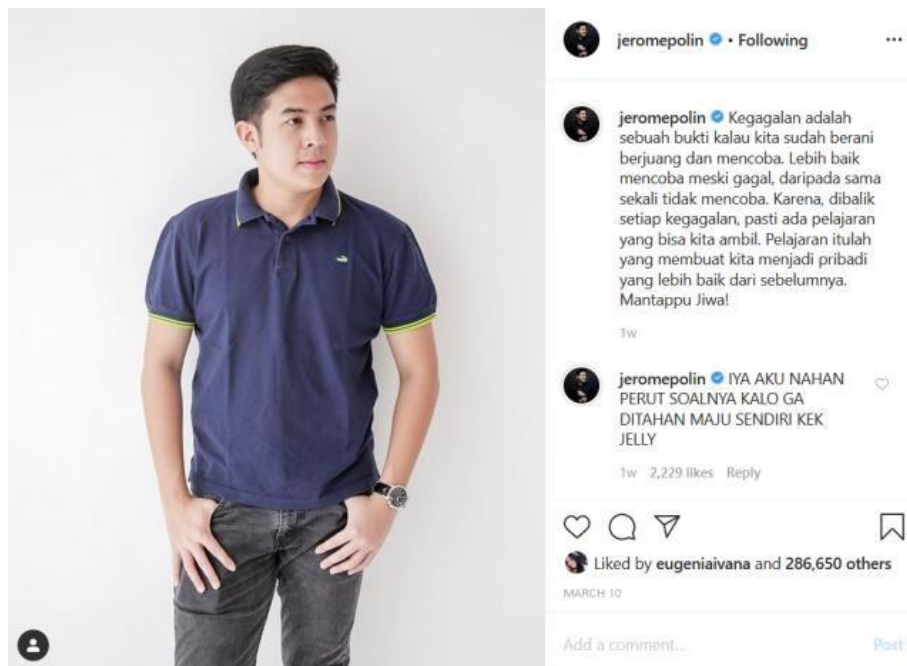
Gambar 1. 3 Instagram Jerome Polin dengan kata-kata motivasinya

ribu orang yang ikut menontonnya. Banyak remaja yang dari awalnya hanya tidak sengaja menonton Jerome Polin hingga akhirnya benar-benar mengikuti kesehariannya dan tak jarang banyak yang terinspirasi darinya.