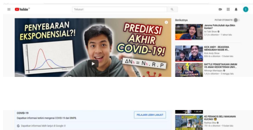
Gambar 1. 4 Video Jerome Polin membahas Covid-19 menggunakan perhitungan matematika

Selain itu biodata dan kisah hidup dari Jerome Polin juga sering sekali dijumpai pada artikel-artikel dari media terpercaya di Indonesia, salah satunya IDN Times yang sudah beberapa kali membahas youtuber kocak yang jago matematika satu ini. Selain itu diketahui bahwa Jerome Polin yang bercita-cita sebagai seorang menteri pendidikan bahkan sampai ada yang menjulukinya sebagai youtuber pendidikan, sering sekali menjadi motivasi dikalangan remaja dalam berprestasi di berbagai bidang yang ada dan hal tersebut membuat remaja merasa terlibat dengan konten-kontennya pada channel Nihongo Mantappu. Hal ini membuktikan bahwa Jerome Polin menunjukkan kredibilitas sebagai seorang influencer dan menginspirasi banyak orang terutama kalangan remaja.