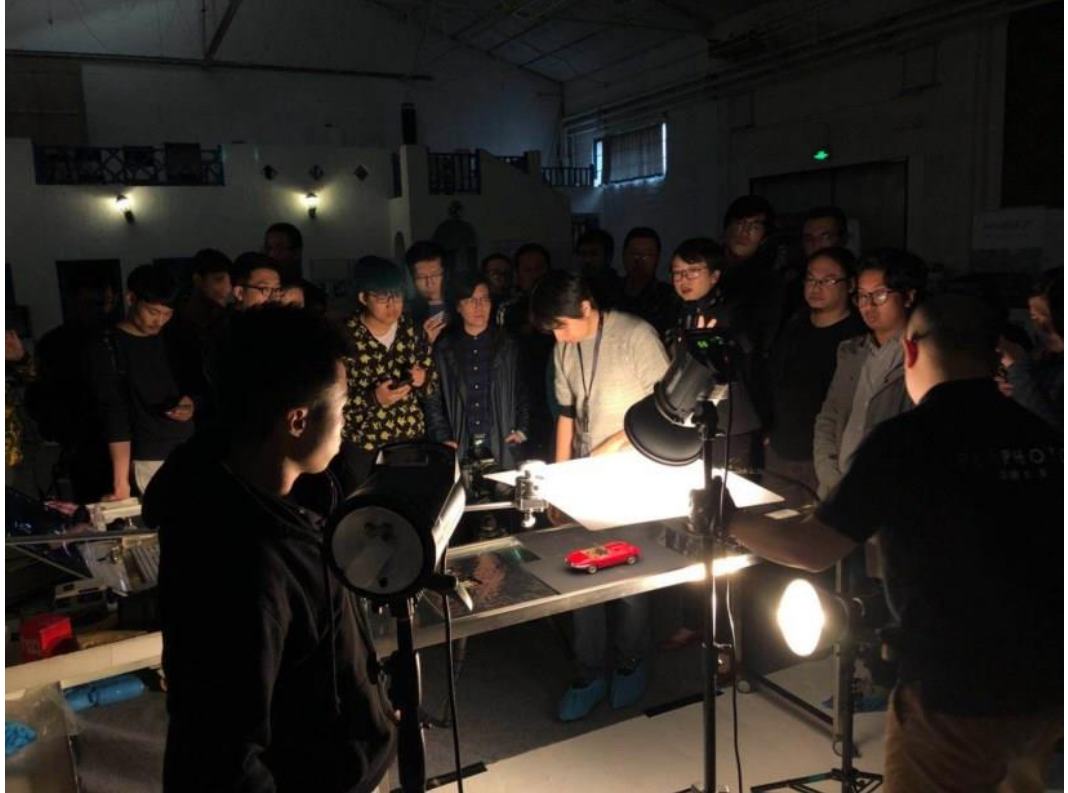
Gambar 2.2. Acara PhaseOne x Eric Dinardi di Beijing pada 2018

format yang digunakan untuk kebutuhan fotografi industrial dan editorial yang memerlukan kualitas tinggi dan daya cetak yang besar.