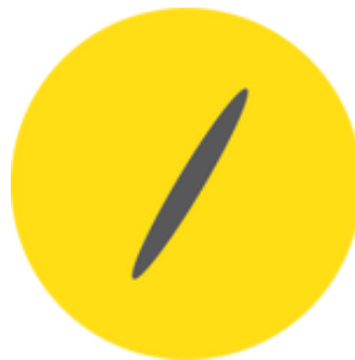
Gambar 2.1. Logo perusahaan Bacteria Photography

Bacteria Photography adalah perusahaan yang bergerak di bidang fotografi untuk kebutuhan komersil. Perusahaan ini sudah berjalan sejak Desember 2004 dan telah mendapatkan kepercayaan untuk membuat foto dari berbagai perusahaan. Bacteria Photography telah mengerjakan proyek-proyek besar antara lain: Daihatsu, Lady Americana, IRC Tire, Gyukatsu, Aice, CFC, dan lain-lain.