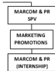
Bagan 2.2 Struktur Ruang Lingkup Divisi Marcom & PR