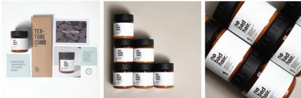
Gambar 2.5 Portfolio CDA no bad hair

No bad hair merupakan produk kosmetik rambut berupa hairclay yang berfungsi untuk membentuk atau menata rambut sesuai dengan keinginan penatannya. Peran CDA dalam kerja sama ini adalah sebuah Product Campaign dalam media digital.