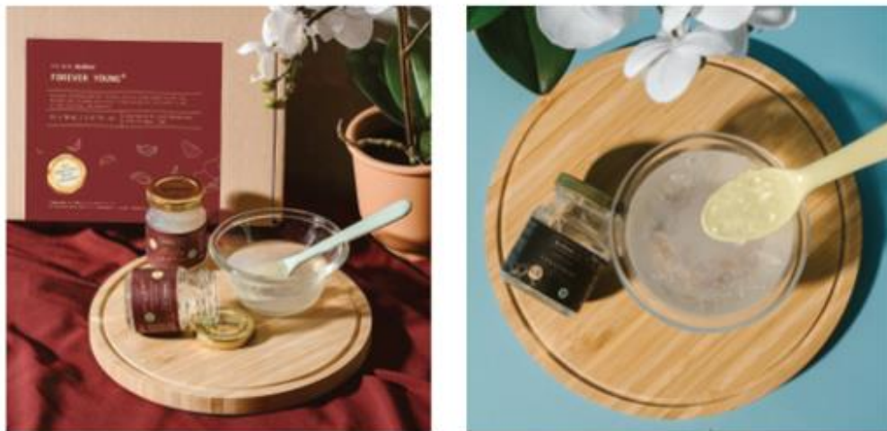
Gambar 2.4 Portfolio CDA fitwithrealfood

Fitwithrealfood merupakan salah satu industri yang bergerak di bidang suplemen kesehatan dimana produknya menyediakan minuman berbahan dasar sarang