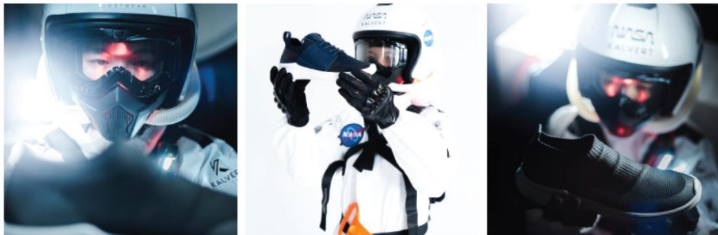
Gambar 2.6 Portfolio CDA Kalvert Shoes

Kalvert shoes merupakan brand footwear yang menyediakan berbagai macam jenis sepatu berbahan dasar kulit. Peran CDA dalam kerja sama ini Product Campaign dalam media digital.