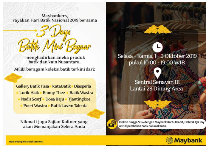
Gambar 3. 3 Batik Mini Bazaar

banyak belajar mengenai cara menggunakan mesin edc , promo kartu kredit, dan cicilan.