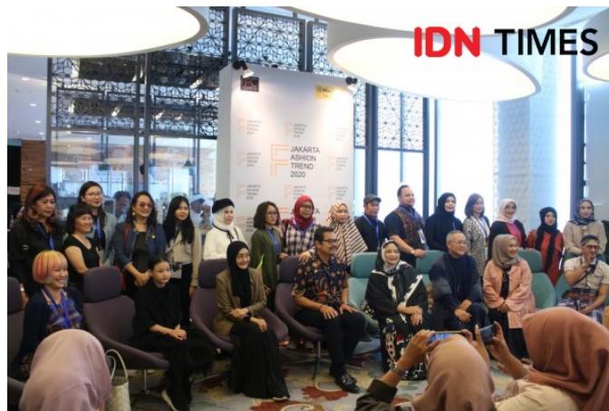
Gambar 3. 5 Press Conference Jakarta Fashion Trend 2020

Dalam press conference Jakarta Fashion Trend 2020, penulis diminta untuk mendata media mana sajakah yang datang untuk meliput kegiatan pagelaran tersebut. List media yang datang penulis masukkan kedalam Microsoft Excel, data ini bertujuan untuk mendapatkan contact media yang sudah datang untuk kita undang kembali jika ada acara selanjutnya, sehingga media tersebut bisa kembali meliput.