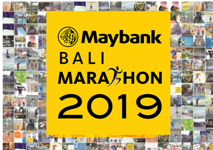
Gambar 3. 2 Maybank Marathon Bali