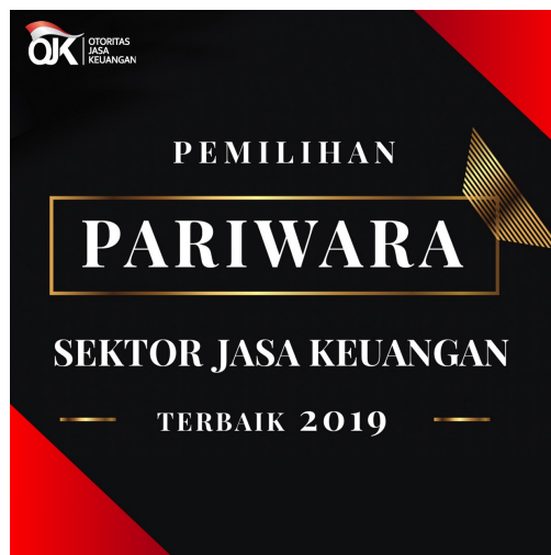
Gambar 3. 4 Pariwisata OJK