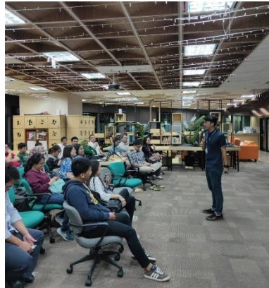
Gambar 2.2 Suasana ToffeeTalk