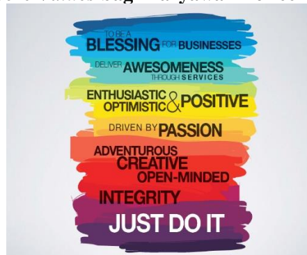
Gambar 2.4 Core Values bagi Karyawan ToffeeDev