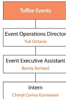
Gambar 2.5 Struktur Lingkup Kerja Divisi Toffee Events