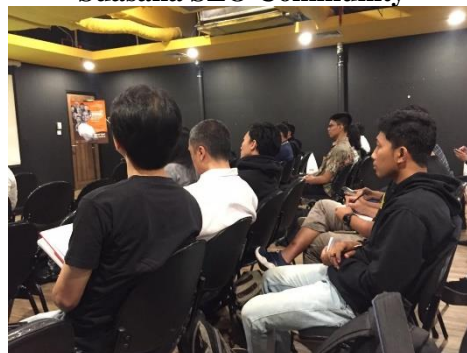
Gambar 2.3 Suasana SEO Community