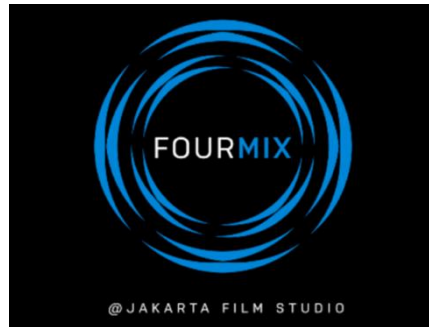
Gambar 2.1 Logo Perusahaan (Dokumentasi Perusahaan, 2020)

Pada tahun 2000, PT FourMix didirikan oleh Satrio Budiono yang adalah seorang penata suara asal Indonesia. FourMix adalah perusahaan audio postproduction pertama di Indonesia yang memiliki fasilitas Theatrical Atmos Mix Stage untuk pengeditan audio. Studio FourMix mengerjakan proses pascaproduksi audio film, baik itu film layar lebar maupun film pendek, iklan, atau webseries . Saat ini, FourMix berlokasi di Jakarta Film Studio milik MD Entertainment, di Jl. Raya Ceger No.1, RT.5/RW.1, Ceger, Kec. Cipayung, Kota Jakarta Timur. Namun, saat baru pertama kali didirikan, studio FourMix berlokasi di Jakarta Selatan, tepatnya di Jl. Daksa 2 No.6, Kebayoran Baru. Studio FourMix berpindah ke lokasi baru di Ceger pada bulan November di tahun 2019.