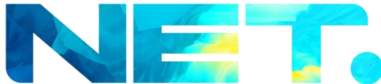
Gambar 2.1. Logo PT. Net Mediatama