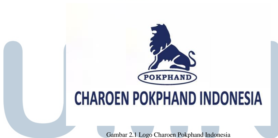
Gambar 2.1 Logo Charoen Pokphand Indonesia

Nama perusahaan: PT. Charoen Pokphand Indonesia