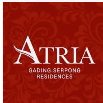
Gambar 2.1 Logo Atria Residences Gading Serpong

Atria Residences Gading Serpong merupakan salah satu sub-unit bisnis perhotelan dibawah naungan PARADOR Hotels and Resort yang merupakan salah satu unit bisnis bidang perhotelan dari PT Paramount Enterprise. Atria Residences Gading Serpong terletak di pusat kawasan CBD Gading Serpong yang bertujuan untuk mengakomodasikan konsumen dari berbagai perusahaan atau unit bisnis manapun yang berada di sekitar area Tangerang, Jakarta Barat dan sekitarnya. Dulunya, Atria Residences Gading Serpong merupakan sebuah apartemen yang dikelola juga oleh Paramount Enterprise. Saat ini lantai 1-10 dari Atria Residences Gading Serpong merupakan sebuah residential hotel yang dikelola oleh PARADOR Hotels and Resort sedangkan untuk lantai 11-21 merupakan apartemen yang dikelola oleh PT Paramount Enterprise.