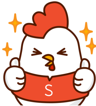
Gambar 2.2 Maskot Shopee Indonesia (Choki)