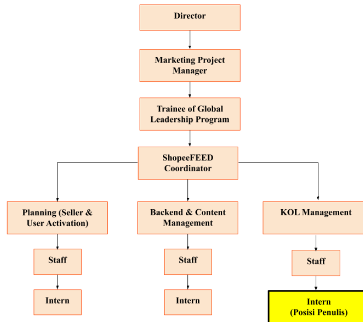
Gambar 2.4 Pembagian Tim Marketing Project ShopeeFEED