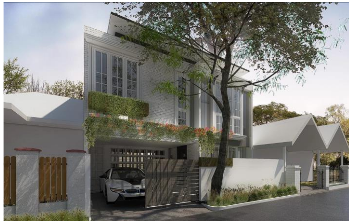
Gambar 3. Rumah Jati Asih sumber: https://www.cnd-architect.com/project-jatiasih (2017)

CND Architect dapat menangani berbagai jenis proyek dari skala kecil sampai besar, seperti residensial, hotel, rumah tinggal pribadi, sampai pusat transportasi dan bangunan kelembagaan. Proyek pertama CND Architect adalah desain rumah pribadi yang bernama Rumah Jati Asih yang terletak di Bekasi. Dari proyek tersebutlah CND memulai kariernya. (CND Architect, 2017)