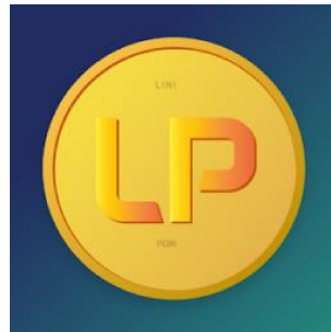
Gambar 2.1.2 Logo LINIPOIN

Aplikasi ini merupakan aplikasi gametification dari MacroAd sebagai media berbasis platform digital untuk memberi ruang iklan yang interaktif bagi konsumen.