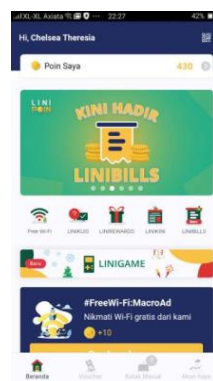
Gambar 2.1.3 Aplikasi LINIPOIN

Fitur di dalam aplikasi ini, antara lain LINIKUIS, LINIREWARDS, LINIKINI, dan My Poin . Jadi di setiap harinya, terdapat kuis berupa pertanyaan beserta hint untuk menjawab pertanyaannya, lalu di setiap jawaban yang benar user akan mendapatkan 10 poin yang nantinya dapat diredeem dengan pilihan voucher yang tersedia di LINIREWARDS. Aplikasi ini dapat di- download di Play Store bagi pengguna Android dan App Store bagi pengguna iOS.