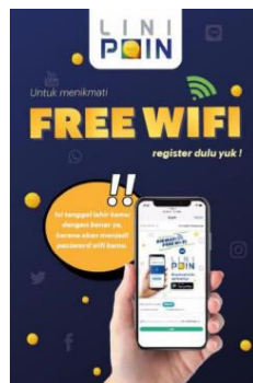
Gambar 2.1.5 Logo #FreeWifi:MacroAD

Yaitu layanan wifi gratis bagi pelanggan setia commuter line di Jabodetabek. Layanan ini tersebar di semua titik stasiun yang tersebar di area Jabodetabek. Untuk bergabung dengan menikmati layanannya, dapat membuka macroad.info dan otomatis akan terkoneksi ke free wifi tersebut dengan memasukkan nomor telepon dan tanggal lahir. Koneksi jaringan free wifi ini tersebar di stasiun commuter line Jabodetabek, 149 Pasar Jaya, dan Argo Parahyangan.