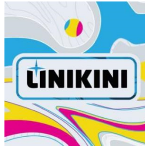
Gambar 2.1.4 Logo LINIKINI

Merupakan sebuah portal berita yang dikelola oleh perusahaan sebagai media penyampaian informasi atau berita kepada publik. Portal berita ini bisa diakses melalui laman web linikini.id .